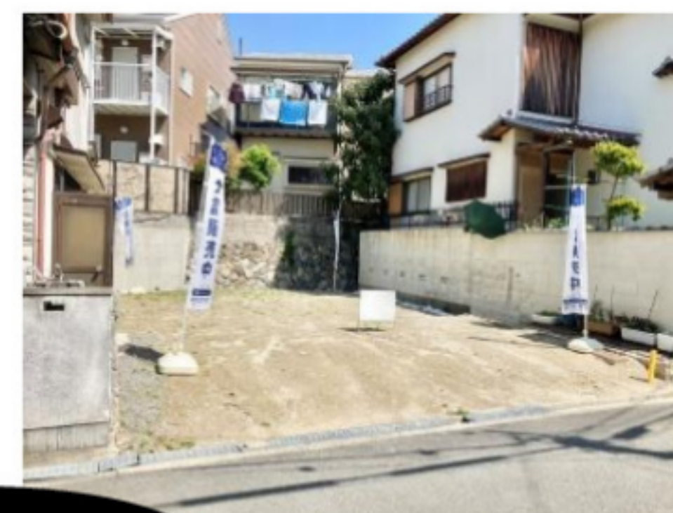
・ 現地写真 ・