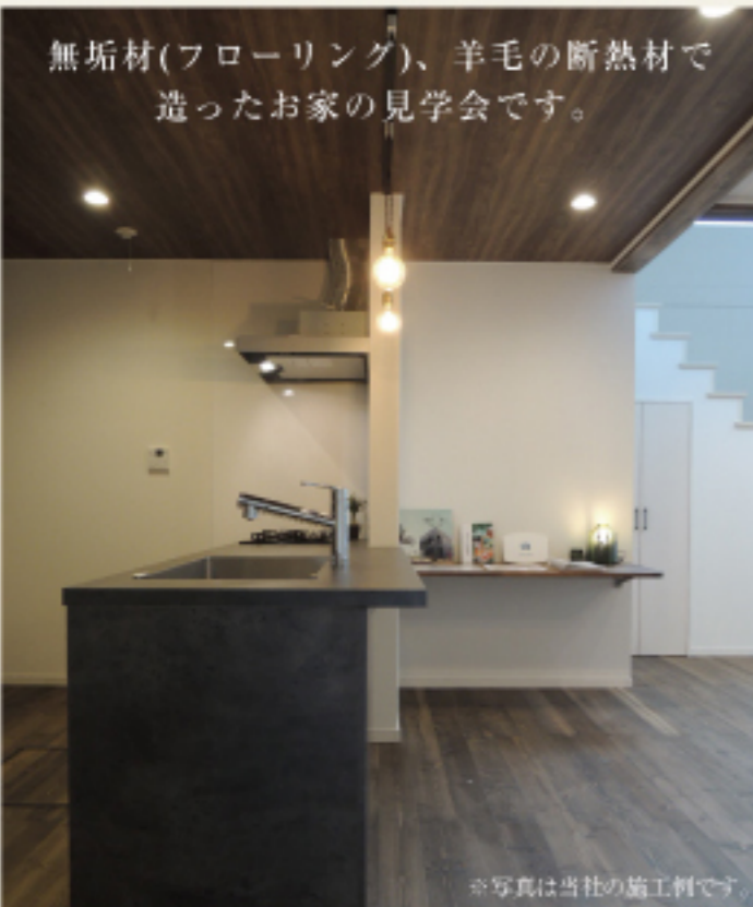
※写真は当社の施工例です。