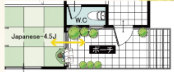
和室からと玄関からとどちらからも使える広々玄関アプローチ。

当社は東淀川区14年連続施工棟数No.1東淀川区、吹田市、箕面市、豊中市などの北摂エリア、城東区、柏原市も合わせるとこれまでに500棟以上のお家をお引渡しさせていただきました。空間の広さや収納の大きさ、クロスの配色などは実際に見て体感していただかないと、なかなかイメージが湧きにくいと思います。絶対のために見学会だと確信しています!