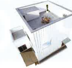
+BOX SKY BALCONY