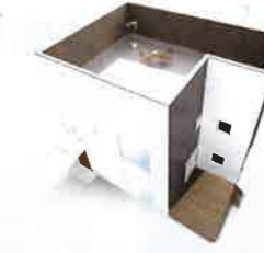
+BOX² SKY BALCONY